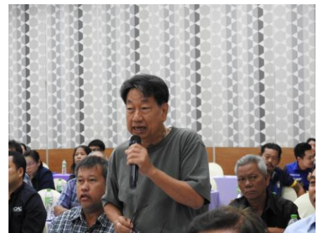
ผู้เข้าร่วมประชุมแสดงความคิดเห็น