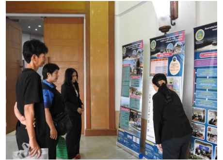
ผู้เข้าร่วมประชุม ชมบอร์ดนิทรรศการ