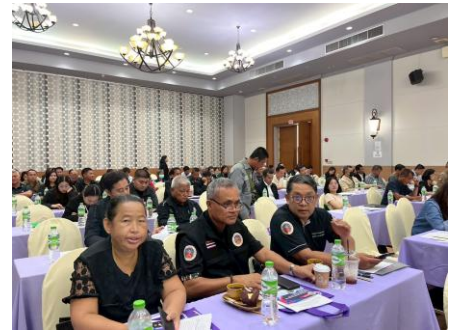
ผู้เข้าร่วมประชุมรับฟังรายละเอียดโครงการ