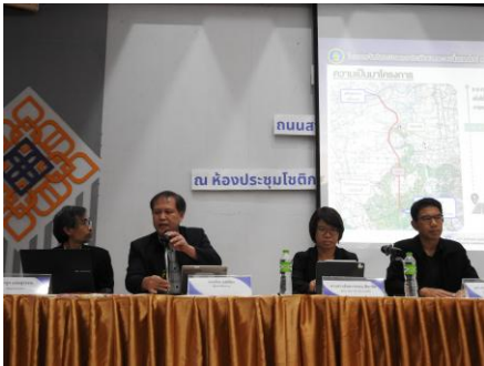
วิทยากรนำเสนอรายละเอียดโครงการ