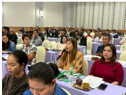
ผู้เข้าร่วมประชุมแสดงความคิดเห็น