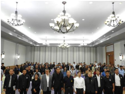
ผู้เข้าร่วมประชุมถ่ายภาพ เป็นที่ระลึกร่วมกัน