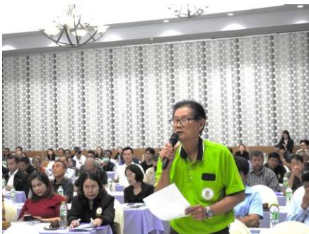
ผู้เข้าร่วมประชุมแสดงความคิดเห็น