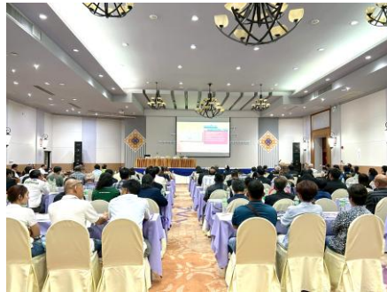
ผู้เข้าร่วมประชุมรับชมวีดิทัศน์