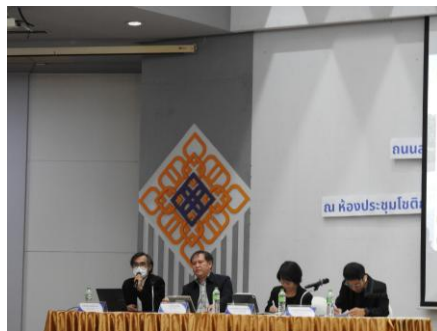
บริษัทที่ปรึกษาตอบข้อซักถาม