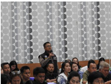
ผู้เข้าร่วมประชุมแสดงความคิดเห็น