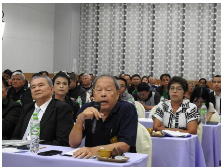
ผู้เข้าร่วมประชุมแสดงความคิดเห็น