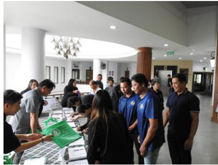
ผู้เข้าร่วมประชุมลงทะเบียน รับเอกสารประกอบการประชุม